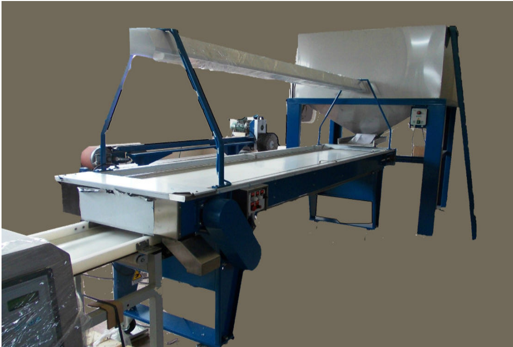
Esempio di carico con cavalletto con vibratore lineare